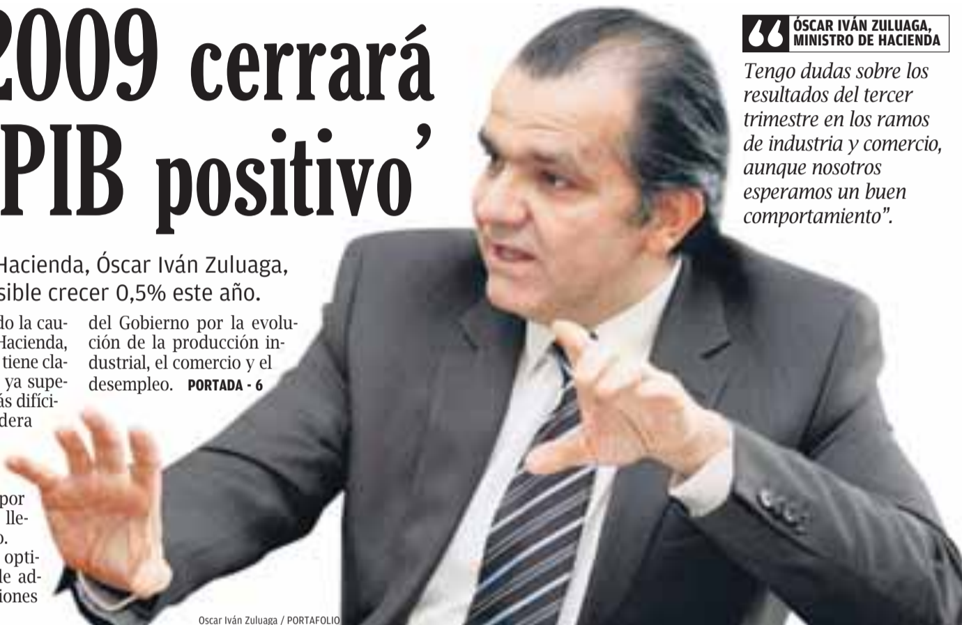
Oscar Iván Zuluaga / PORTAFOLIO

del Gobierno por la evolución de la producción industrial, el comercio y el desempleo. PORTADA - 6